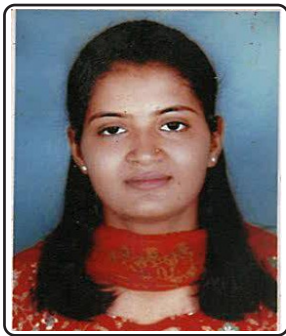
Poonamben Chimambhai Oza Textiles and Clothing